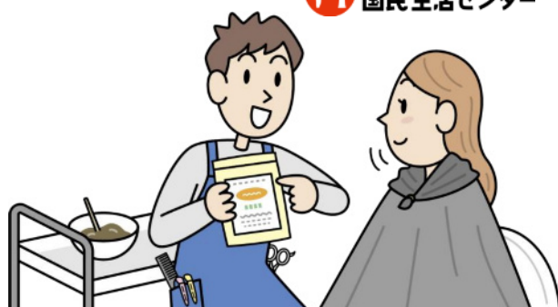
イラスト:川崎敏郎